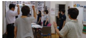
▲9/26 しゅわわ 「地域文化祭」出演に向けて 練習に励んでいます。