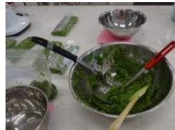
▲10/1 ゆずごしょう作り 沢山の青袖子の皮を使い、丁寧に 仕上げた風味豊かなゆずごしょう。 食べ頃が待ち遠しいです。