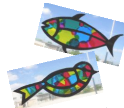
▲10/2 ステンドグラス風飾り 黒の画用紙で魚や鳥のフレームを作り、 カットしたセロファンを貼って完成させ ました。作品は「地域文化祭」に展示。