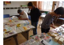
▲9/28 スクラップブック 切り貼りした写真に飾りを付けたり、 色をつけて楽しい作品が出来ました。