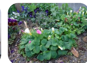
いただいた苗から成長したオキザリス