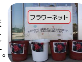
いただいたカンナの球根

ご家庭で増えすぎてしまった花々(苗)がありませんか。生楽館では、持ってこられた花を次の方につなぎ、広げる“フラワーネット”を行っています。苗や球根を生楽館までお持ちください。